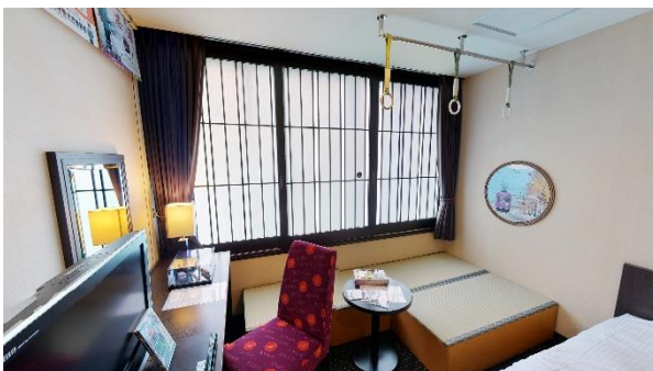
▲畳スペース、つり革、優先席シートモケット