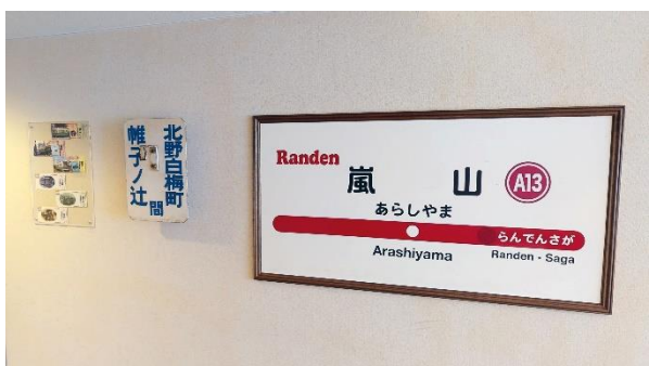
▲記念乗車券・旧行先方向板・駅名標